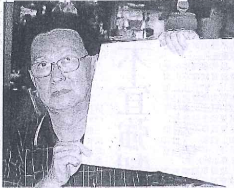
厅索赔立场。刘运生手执入禀法庭书，强调向瓜登市政

Kuala Terengganu Mayor Datuk Mat Razali Kassim could not be reached for comment.